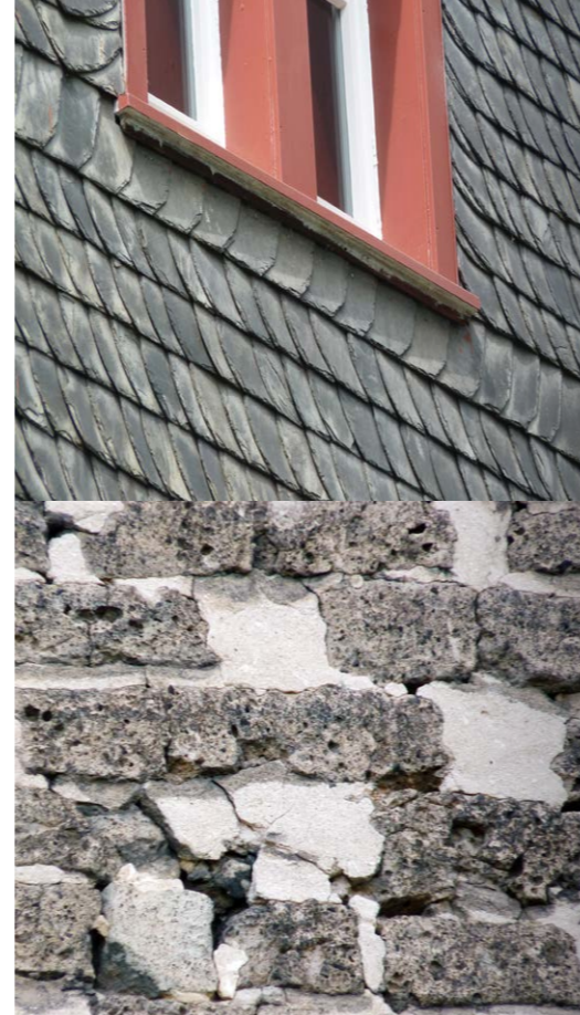
Einfluglöcher unter einer Schieferverkleidung im Bereich unter der Fensterbank und in einer Mauer, die jeweils von der Zwergfledermaus genutzt werden