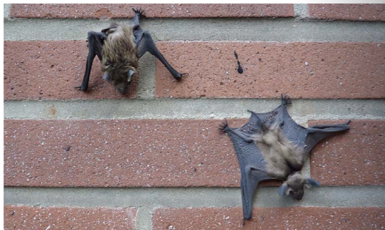
Junge Breitflügel-Fledermäuse