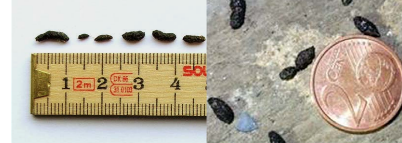
Mäusekot und Fledermauskot (4–10 Millimeter) im Vergleich von Aussehen und Größe

Fledermausquartiere aufzuspüren ist jedoch mitunter äußerst schwierig. Fledermausexperten können hierbei helfen. Die Mitarbeiterinnen und Mitarbeiter der Biologischen Station im Ennepe-Ruhr-Kreis e.V. und der Biologischen Station Umweltzentrum Hagen e.V. können Ihnen dabei behilflich sein (Kontaktadressen Seite 11).