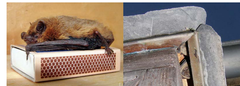
Zwergfledermaus im Größenvergleich; Fledermäuse sind in Spaltenquartieren nur schwer aufzufinden