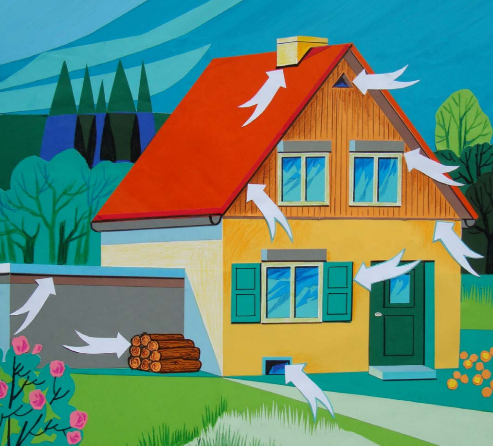
Beispiele für potenzielle Quartiere von Fledermäusen an Gebäuden