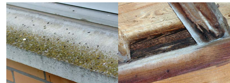
Fledermauskot auf einer Fensterbank und Verfärbung an Dachbalken